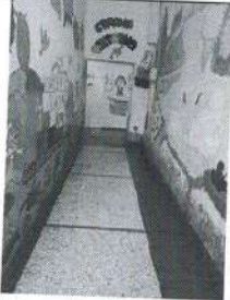
фото № 7