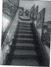
фото № 8